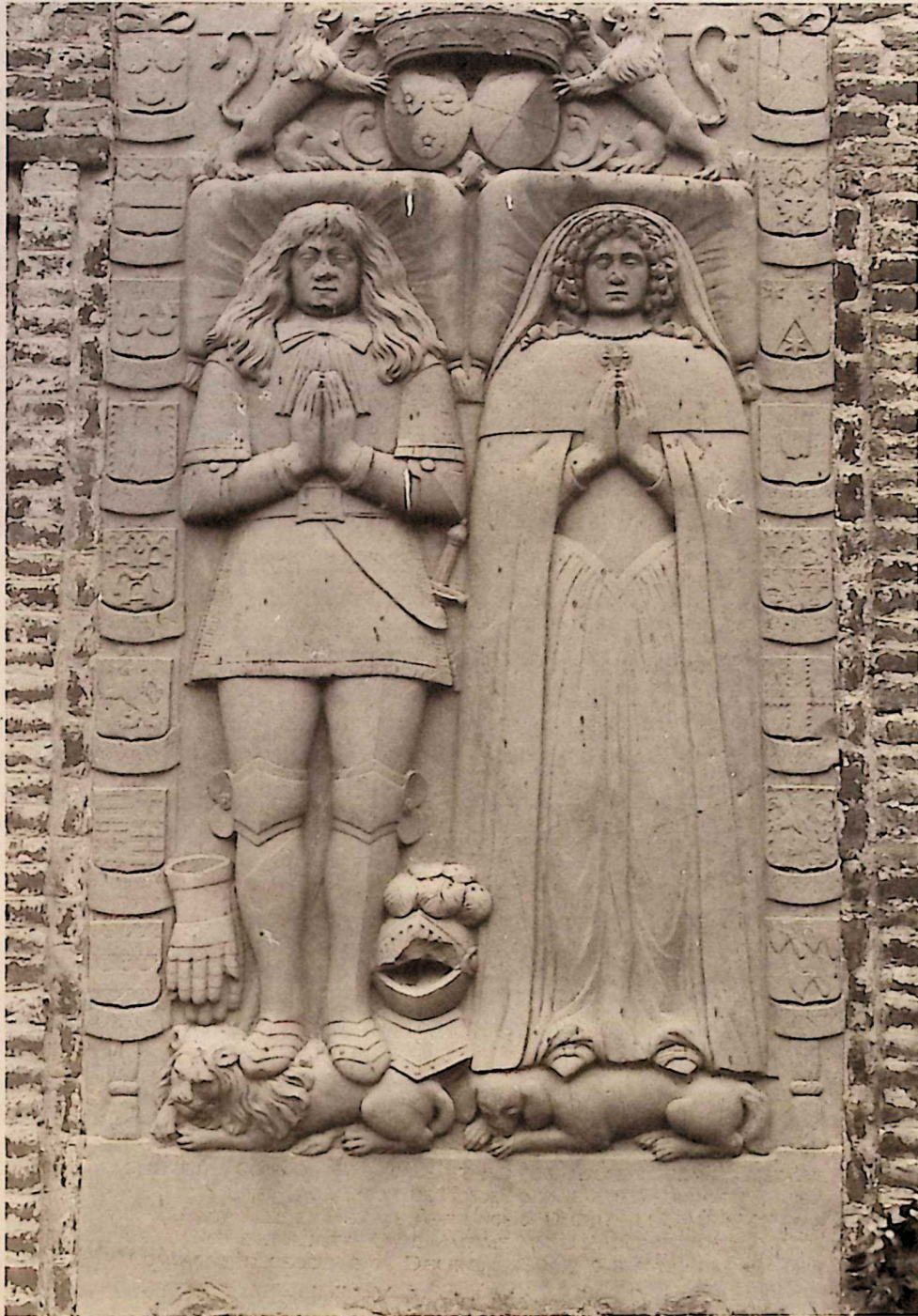
Fig. 2. Pierre tombale de Eustache-Charles de Salmier et de Anne d'Enghien dite de Havrech, seigneurs de Hosdent au XVII e siècle.